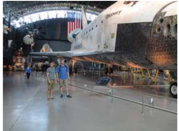
Die seuns by die Shuttle Discovery

die tyd dat die deure om 10h00 geopen het, het ons al behoorlik gesweet in die "Durbanhitte." Ons is met tipiese Amerikaanse vriendelikheid verwelkom en die effektiewe sekuriteitspersoneel het vinnig ons rugsakke deursoek. Daartna kon ons die res van die dag in 'n heerlik verkoelde omgewing ons verkyk aan al wat 'n vliegtuig is waaraan mens kon dink. Noem dit maar, van die B-29 "Enola Gay" (wat die eerste atoombom afgegooi het), SR 71 (Blackbird), Concorde, Bucker Bu-133C Jungmeister tot die Space Shuttle Discovery en alles tussenin – té veel om op te noem. Dit alles onder een dak, wat seker so groot soos 4 of 5 rugbyvelde is, en om alles te kroon GRATIS en VERNIET.