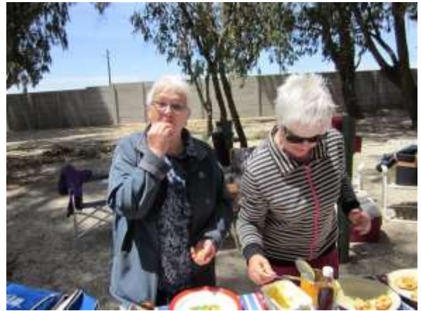
. . . . and a lot was eaten.