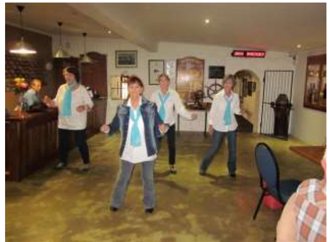
The Line Dance teachers