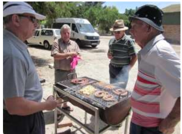
And the braai . . .