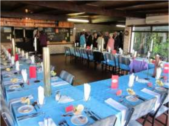
Tables beautifully set

Thanks to all the organisers of the banquet.